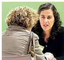
Una mujer en una entrevista.

A la hora de acudir a una entrevista laboral, es muy importante transmitir una buena impresión aunque hav muchas veces que no se sabe cuándo la vestimenta es la más adecuada. En 'Fashion Assistance' te aconsejan sobre cómo debes ir va que depende para que sea el duesto.