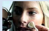
Una mujer pintándose.

Te organizan desde la cita con la tienda de novias hasta las mesas, sin olvidar las alianzas, las flores v todo el protocolo que conlleva el evento. Además, el día de la boda también van a tu casa para avudarte con los retoques finales en el maquillaje, peinado v vestido.